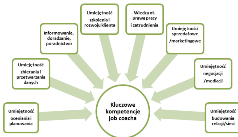
Rysunek 1. Kluczowe kompetencje JC/N wywiedzione z koncepcji wspomaganego zatrudnienia wg EUSE