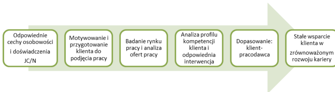
Rysunek 2. Funkcjonalne ujęcie kompetencji JC/N na bazie koncepcji wspomaganego zatrudnienia